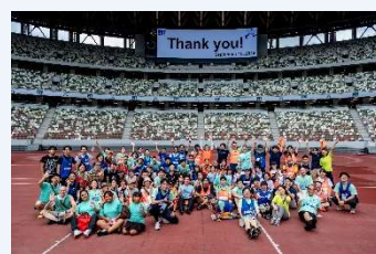
2024年実行委員会メンバー（一部）

A. 毎年5,000-6,000人が参加するFITチャリティ・ランを企画・運営しています。FIT実行委員メンバーは様々な金融機関や関連事業を展開する企業から集まった約50名のボランティアから構成されています。