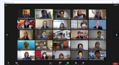
Organising Committee Meeting via Zoom

A. The Organising Committee and Subcommittee each meet once a month. They also meet as needed as the event dates approach. Each Subcommittee divides its work among its members, helping each other according to the members' situations, which generally takes about one hour per week.