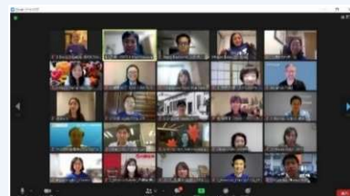
オンライン会議風景

A. 全体会議、サブコミティがそれぞれ毎月1度の会議を行っています。イベント開催日が迫るにしたがって必要に応じて開催しています。各サブコミティではお仕事の状況に応じてサポートしあいながら業務を分担しており、概ね週に1時間程度が目安になります。