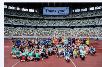
FIT2024 Organising Committee Members

A. Organises and manages the annual FIT Charity Run, which attracts 5,000-6,000 participants each year. Over 50 volunteers from various financial institutions and related businesses make up the FIT Organising Committee.